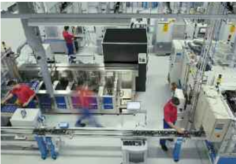
Ligne automatisée d'usinage des têtes fémorales à Marktredwitz

Les machines sont conçues pour produire aussi bien des composants en BIOLOX®forte qu'en BIOLOX®delta. Mais la tendance actuelle va clairement vers BIOLOX®delta qui représente aujourd'hui déjà 50 % des composants livrés.