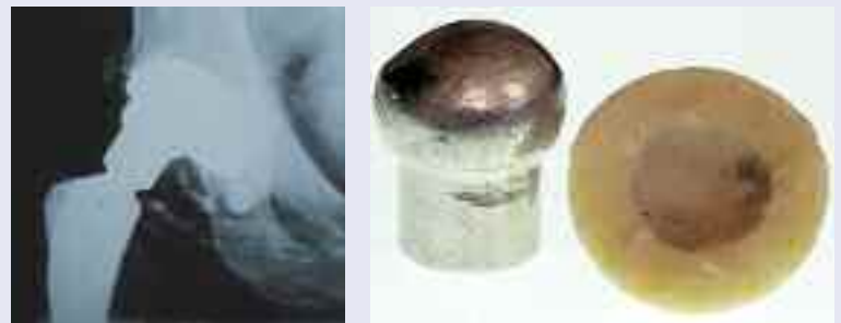
Couple de frottement métal – céramique non autorisé, à 6 mois in vivo (à gauche) et après l'explantation (à droite)

Combinaison de matériaux non autorisée entre une tête fémorale en CoCr et un insert en céramique d'alumine BIOLOX® forte : une patiente âgée de 65 ans consulte son chirurgien 6 mois après l'intervention primaire (PTH côté droit). Elle se plaint de douleurs, fait état de bruits persistants. Lors de la reprise, le chirurgien constate alors une tête fémorale en métal dans un état d'usure très avancé, une usure métallique très élevée ainsi qu'une métallose sévère.