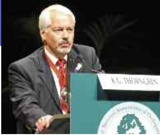
Le Président de L'EFORT, Pr. Karl-Göran Thorngren lors du discours d'ouverture

Simon Jameson (Glasgow, Royaume Uni) a passé en revue et comparé trois types d'articulations métal – métal afin d'analyser la fréquence des lésions de type ALVAL. Il a détecté 5 cas de lésions de type ALVAL histologiquement avérés en absence d'infection chez 961 patients. Dans tous les cas les patients étaient des femmes. Les niveaux d'activité diminuaient et la douleur augmentait 6 à 12 mois après l'opération. Une augmentation de la douleur dans la jambe dans toute sa longueur constituait une découverte caractéristique pouvant résulter d'une effusion significative trouvée autour de la hanche à chaque révision. Tous les patients ont été repris et ont reçu un couple céramique – céramique avec une amélioration des résultats. Jameson de souligner que la fréquence des lésions de type ALVAL était susceptible d'être sous-diagnostiquée et était sans doute plus élevée que ce qui pouvait