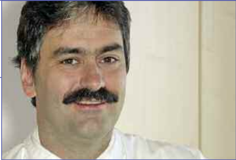
Pr. Carsten Perka, Berlin

Pouvez-vous quantifier l'entraînement nécessaire avant de pouvoir procéder à une première implantation ? Tout d'abord, une bonne formation de base est indispensable, avec des connaissances précises en anatomie, et puis, dans la mesure du possible, des poses sur cadavre. On a ensuite besoin d'être