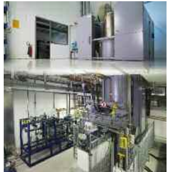
Heiß-Isostatische-Pressen zum Nachverdichten der Keramik in Marktredwitz (Schnittbild)

Die Anlagen sind für die Herstellung beider Materialien ausgelegt. Aber der Trend geht eindeutig zu BIOLOX® delta. Sein Anteil liegt bereits heute bei rund 50 Prozent der ausgelieferten Komponenten.