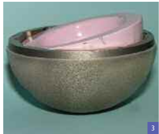
Die Positionierung des Inserts wird durch das Abtasten des Pfannenrandes überprüft und gegebenenfalls korrigiert: Es muss ein planflächiger Abschluss von Metall- und Keramikrand gegeben sein. (1) Röntgenaufnahme eines verkippt eingesetzten Keramikinserts in einer 32-mm-Gleitpaarung. (2) Verkippt implantiertes Keramikinsert, das konsekutiv ein Implantatversagen auslöste. (3)