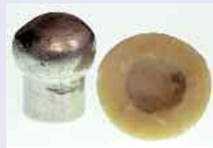
Unzulässige Metall/Keramik-Gleitpaarung, 6 Monate in vivo (links) und nach der Explantation (rechts)